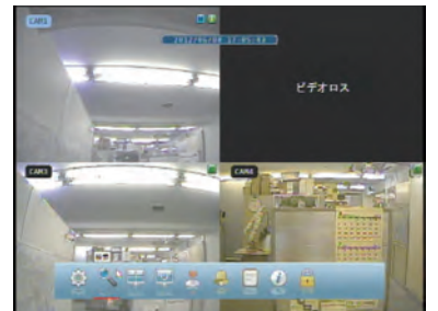
見やすいフロント・GUI