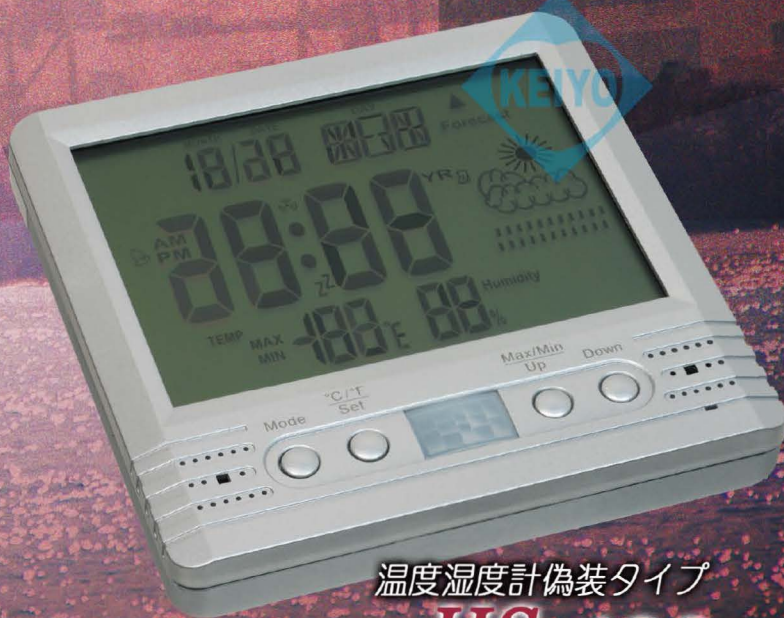
温度湿度計偽装タイプ HS-400

【性能諸元】●撮像素子：1/4型 CMOS イメージセンサー●画素数：200万画素●記録方式：MJPEG/AVI●画角：42.8度●動画記録モード：640×480(VGA)/30fps、1280×720(HD720P)/30fps●静止画：1600×1200/JPG●記録媒体：MicroSDMemoryCard 最大32GB●最低被写体照度 (HS200/300/400)：1.3Lux/1.3Lux/3.3Lux●音声マイク：OK●電源 (HS200/300/400)：950mA/1200mA/1400mA Li-ion バッテリー●充電時間 (HS200/300/400)：約3時間 / 約3～6時間 / - ●電池寿命 (HS200/300/400)：約260分 / 約11時間44分 / - (VGA)、約320分 / 約4時間50分 / - (HD720P)●連続待機時間 (HS200/300/400)：約8日間 / 約8日間 / 約9日間●動体検知：PIR 赤外線人感センサー●タイムインサート機能●動作LED表示●入出力端子：USB2.0 インターフェース●外形寸法 (HS200/300/400)：86×86×16mm/120×70×12mm/100×100×15mm●重さ (HS200/300/400)：80g/85g/134g