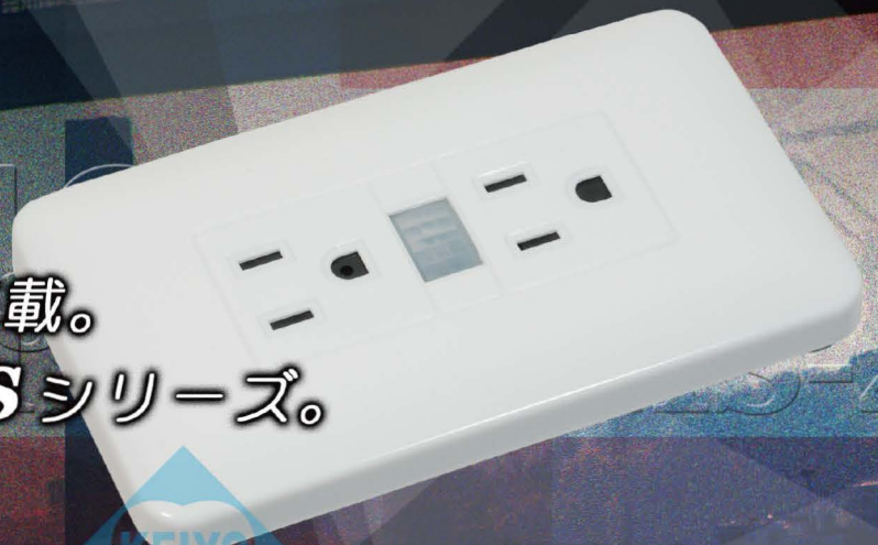
コンセント擬装タイプ HS-300